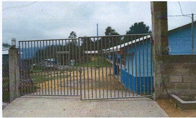
FINALIZACIÓN DEL PORTÓN